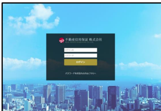
HPの会員ログインページ（提供終了）